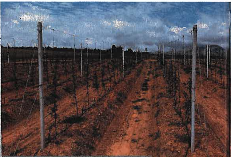
Forelle-pere wat vanjaar aangeplant is. Die bome word opgelei met sementpale wat uit Italië ingevoer is. Houtpale is te dikwels in dié wese visier.