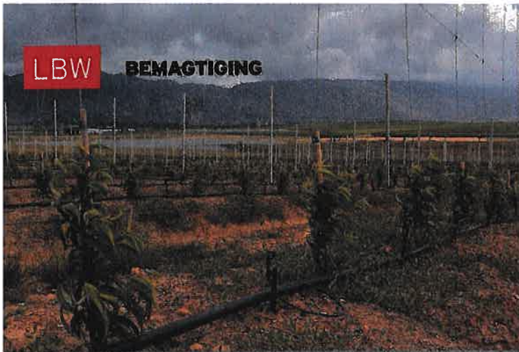
'n Plat nektarien-kultivar, wat tans baie gewild is, maak deel uit van die eerste aanplantings by Kaja-boerdery. Die steenvrugte word by Kalos verpak en deur Stems bemark.