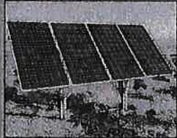
Ons voorsien ENIGE GROOTTE geskeerde pompe tot 75kW en selfs groter!